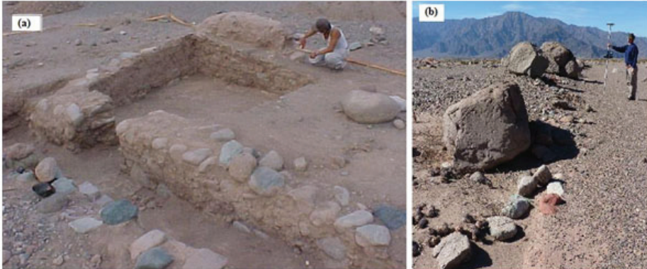
Figura 4. Sector del sitio Batungasta emplazado en la margen derecha del río La Troya, 1500 msnm. Adscripción: Inca. (a) Excavación del Rec.1 (Cjto.1). Vista de relicto de muro de adobe y por debajo cimientos pétreos de muro doble. (b) Grandes rocas transportadas por flujo masivo de agua y rocas que fueron depositadas por encima del muro norte de la plaza incaica del sector este del sitio con respecto a la RN60

b) Por su parte, en los alrededores de Mishma 7 (1750 msnm) se documentó la existencia de tocones de algarrobo o chañar, lo que hace pensar en la existencia de bosques en sus inmediaciones. El sitio pertenece a la localidad homónima donde las tareas de relevamiento en sentido este-oeste y sur-norte que abarcaron 8 y 3 km, respectivamente, registraron gran cantidad de concentraciones de material superficial debido a erosión de las matrices sedimentarias que los contenían, predominando ampliamente el material cerámico Tardío. Particularmente, en Mishma 7 se determinó la presencia de un número mínimo de 35 piezas cerámicas, donde el material incaico representa el 14,3% y el de filiación Tardía el 85,7% (Orgaz et al. 2007). Los fechados radiocarbónicos existentes ubican el desarrollo de esta instalación en los años 1419 \pm 26 de la era.