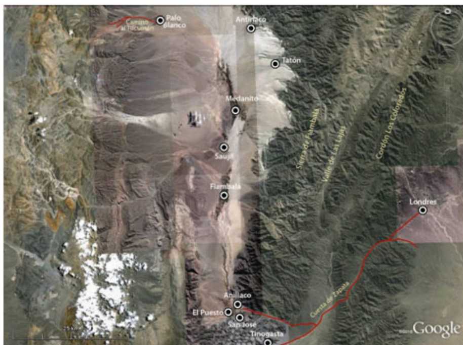
Figura 1. Localización de ciudades, pueblos o parajes actuales de la región de Fiambalá (departamento Tinogasta, Catamarca)