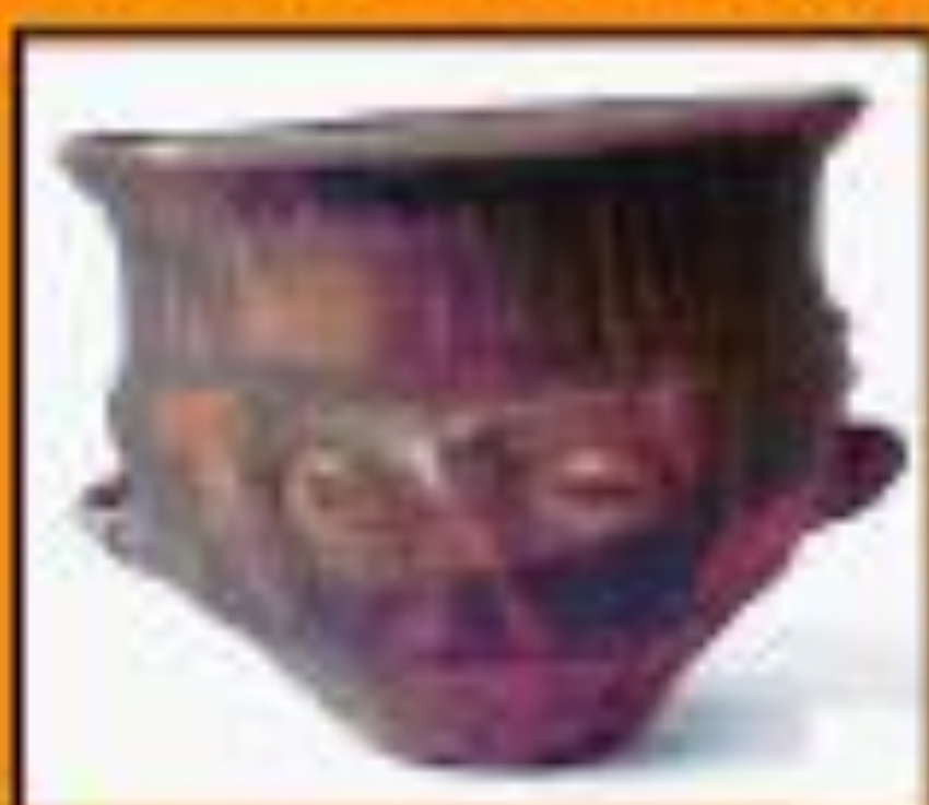
Urua Balón. Procede de La Traya. Dirección General de Arqueología (Zamora)