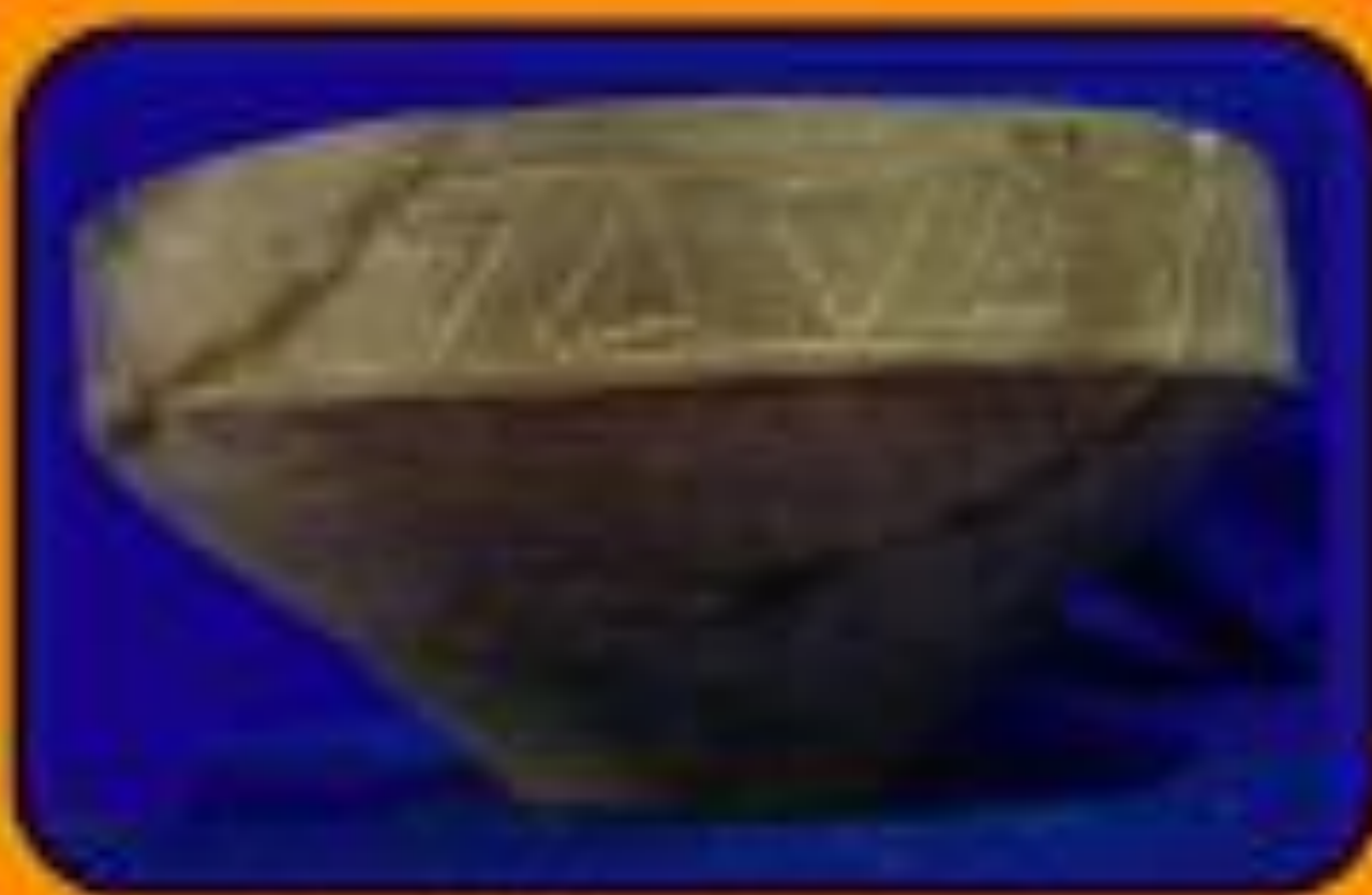
Peso Saqui. Procede de La Traya. Colección Museo Policial (Trompeta)