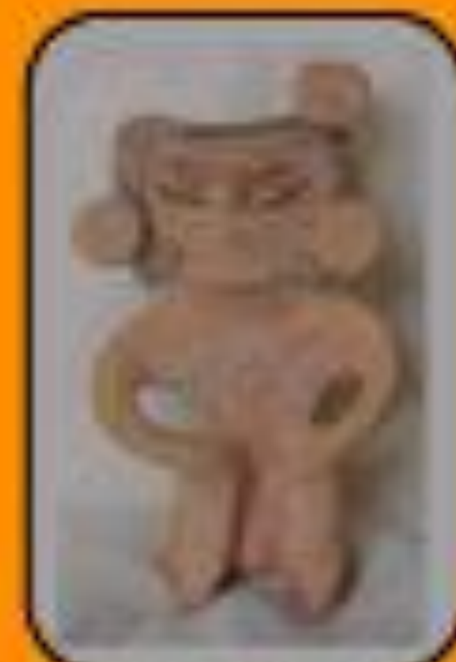
Figura Aguada. Procede de Fiambalá. Colección Museo del Poder (Fiambalá)