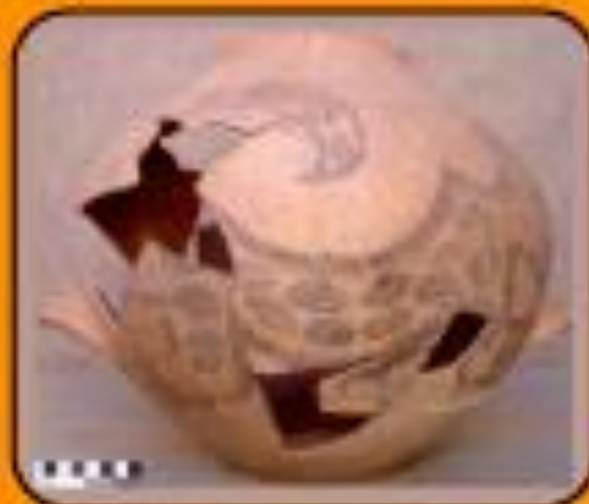
Vaso Aguada. Procede de La Traya. Colección Museo Policial (Trompeta)