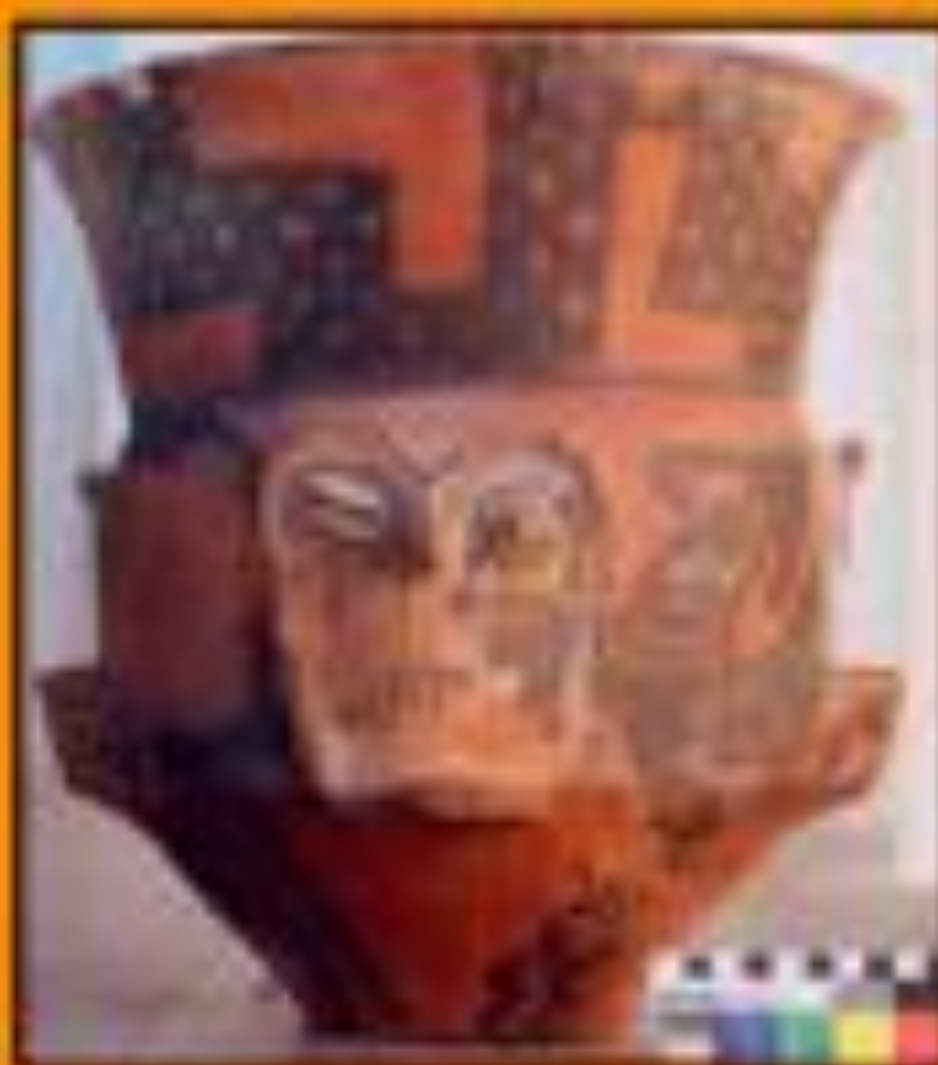
Urua Balón. Procede de Fiambalá. Colección Museo del Poder (Fiambalá)